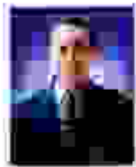
ผศ.เกษม ศรีติมมา รองอธิการบดีฝ่ายวิชาการ