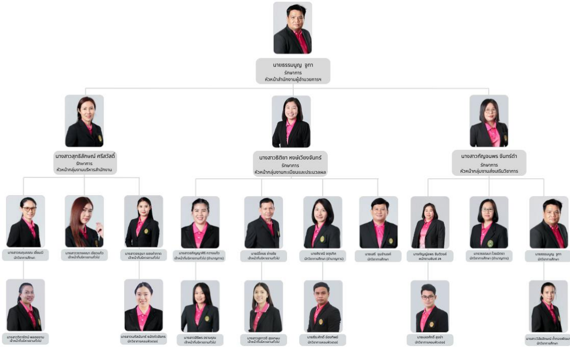
แผนภาพที่ 2 บุคลากรสำนักส่งเสริมวิชาการและงานทะเบียน

จำนวนและศักยภาพของบุคลากร ณ วันที่ 30 กันยายน 2568